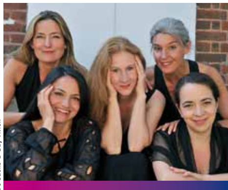
De Caelis © Guy Vivrien