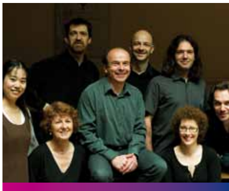
Ludus Modalis © Rebecca Young

20h30 — Chapelle de la Cavée Boudin à Évreux