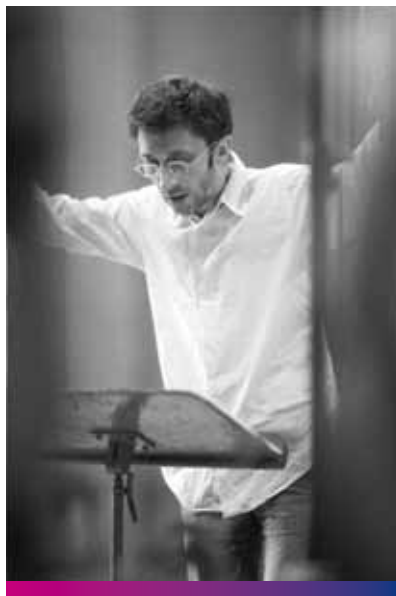
Les Cris de Paris