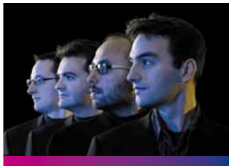
Quatuor Habanera