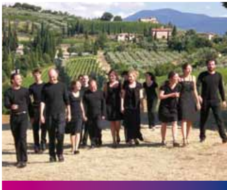
Solistes et Ensemble Vocal du Conservatoire de Rouen