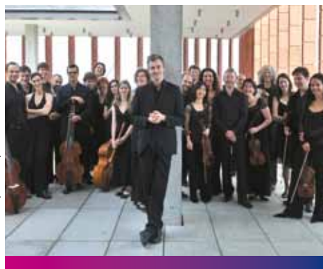
Poème Harmonique