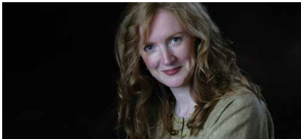
Siobhán Armstrong