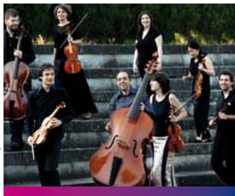
Photo: Gli Incogniti